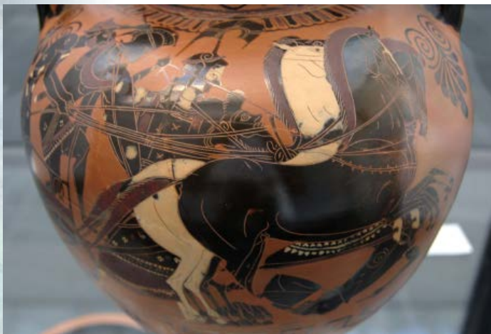
Πλευρά Αττικού μελανόμορφου αμφορέα 530 π.Χ., από το Βούλτσι της Ιταλίας. Γιγαντομαχία: Ο ηνίοχος Φόβος και ο Άρης σε άρμα με την Αθηνά δίπλα τους. Βρίσκεται στο μουσείο τέχνης Staatliche Antikensammlung στο Μόναχο.

Η λέξη δορυφόρος < δόρυ + φέρω, σημαίνει « αυτός που φέρει, που κρατά δόρυ » και χαρακτηρίζει στην αρχαιότητα τους ένοπλους φρουρούς (λογχοφόρους σωματοφύλακες) που περιστοιχίζαν ισχυρά πρόσωπα (βασιλείς ή άρχοντες ) και πολεμούσαν γύρω τους για να τους προστατεύουν.