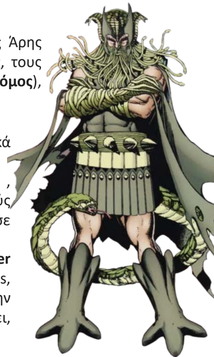
Ο χαρακτήρας του Δείμου στο κόμικ Wonder Woman της DC Comics

Στην ταινία κινουμένων σχεδίων Wonder Woman του 2009, εμφανίζεται ο Deimos, σταλμένος από τον Άρη να σκοτώσει την Wonder Woman. Όταν αποτυγχάνει, αυτοκτονεί!